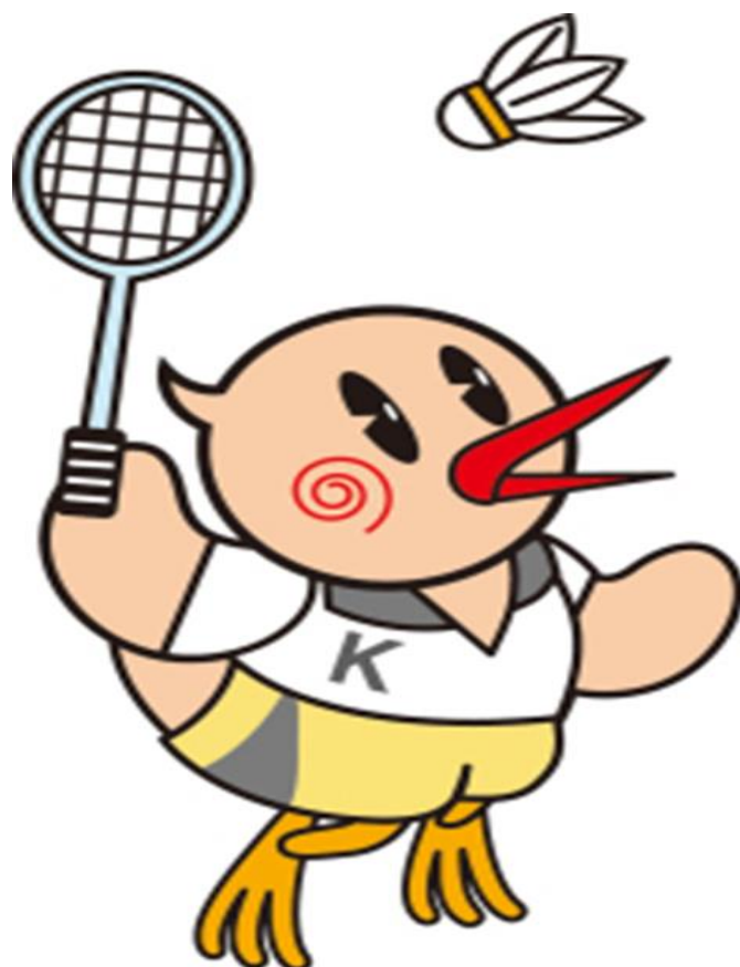
鴻巣市イメージキャラクター 「ひなちゃん」